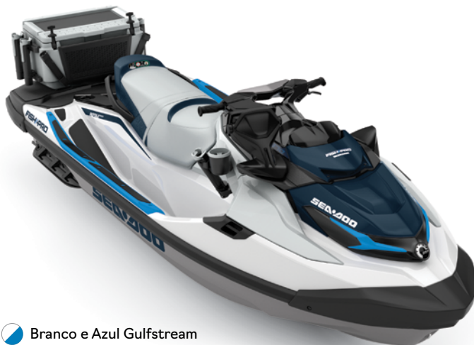
● Branco e Azul Gulfstream