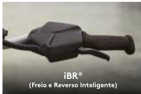
iBR® (Freio e Reverso Inteligente)

Oferece o dobro de ajustes de um VTS™ convencional, facilitando a execução de manobras elaboradas.