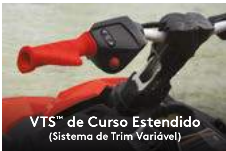
VTS™ de Curso Estendido (Sistema de Trim Variável)

Proporciona muito mais estabilidade e confiança em diferentes posições de pilotagem, tornando mais fácil a execução de manobras.