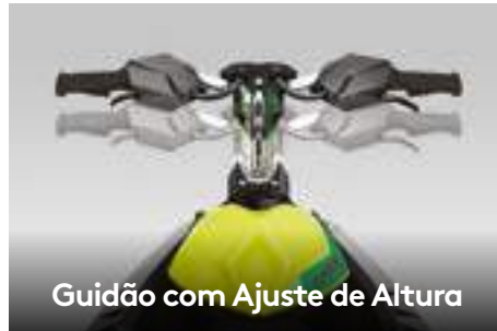
Guidão com Ajuste de Altura

Sistema de som portátil Bluetooth* de alta qualidade, à prova d'água e com 50W de potência.