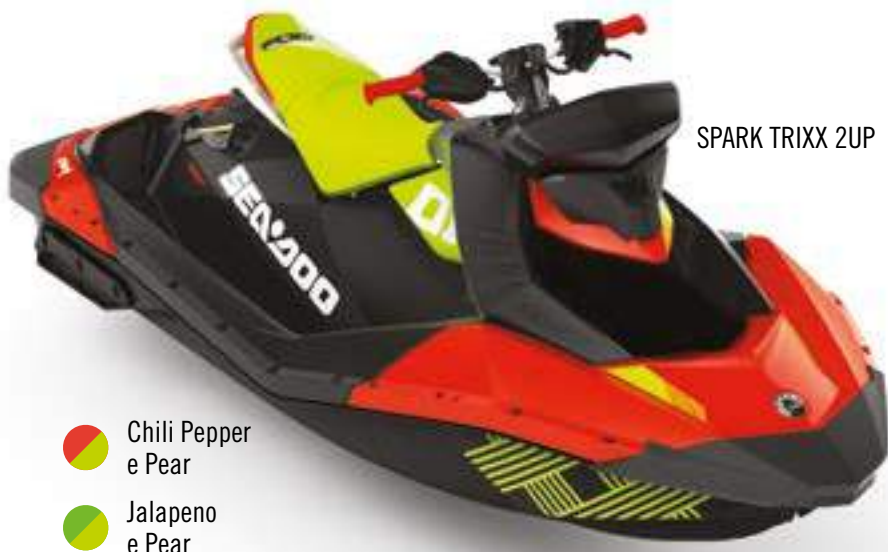
SPARK TRIXX 2UP