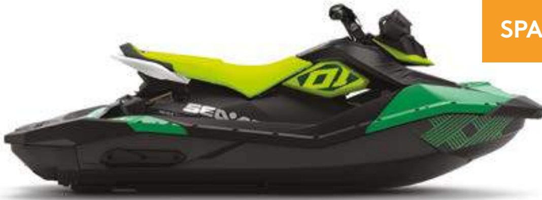
SPARK TRIXX 3UP