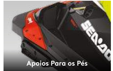
Apoios Para os Pés

Um guidão com ajuste telescópico que otimiza a experiência para os mais variados tamanhos de pilotos.