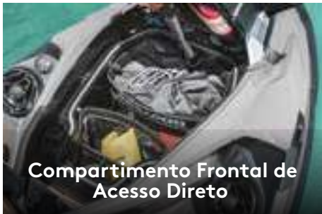
Compartimento Frontal de Acesso Direto

Amplio compartimento frontal facilmente acessível a partir de uma posição sentada. Organizador incluído para maior comodidade.