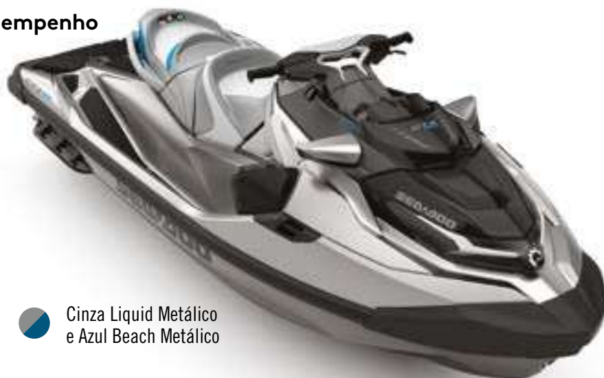
Cinza Liquid Metálico e Azul Beach Metálico