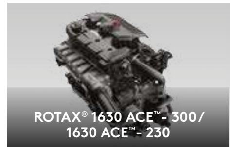
ROTAX® 1630 ACE™ - 300 / 1630 ACE™ - 230

Compartimento à prova de água e choques projetado especificamente para proteção do telefone.