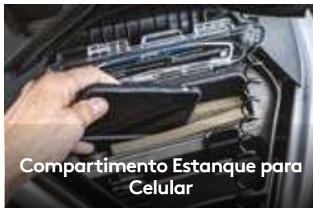
Compartimento Estanque para Celular

Um casco inovador que se tornou referência no mercado para pilotagem em águas agitadas, proporcionando maior estabilidade e desempenho em alto mar.