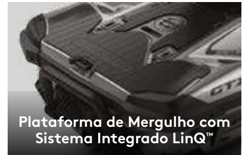
Plataforma de Mergulho com Sistema Integrado LinQ™

O primeiro sistema de áudio Bluetooth ‡ original de fábrica, verdadeiramente à prova de água.