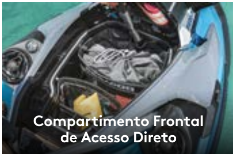
Compartimento Frontal de Acesso Direto

Amplio compartimento de carga frontal, facilmente acessível a partir de uma posição sentada. 1