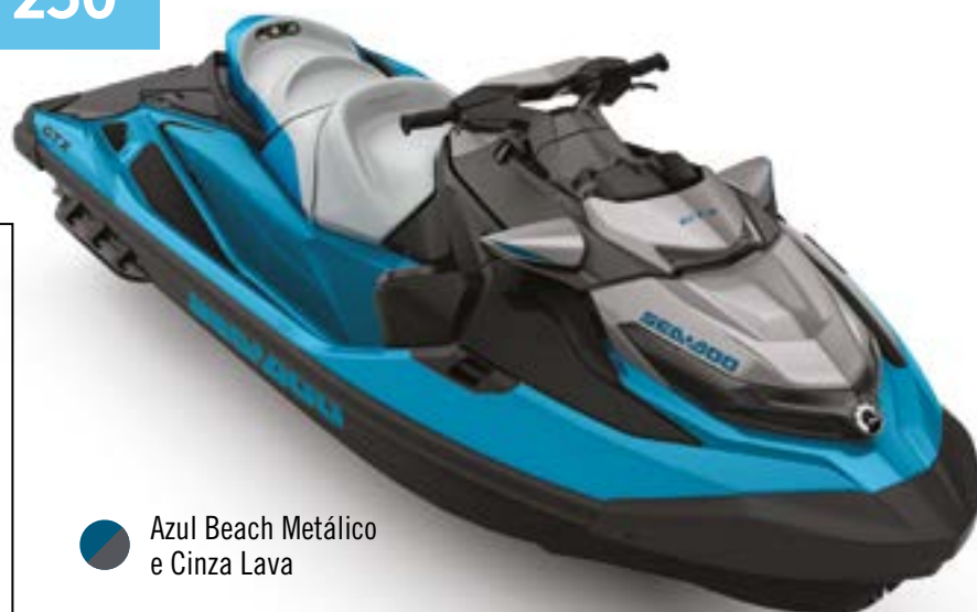
● Azul Beach Metálico e Cinza Lava