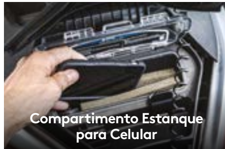
Compartimento Estanque para Celular

O motor Rotax® 1630 ACE - 230 oferece aceleração instantânea por conta de um potente supercharger, enquanto o novo Rotax® 1630 ACE™ - 170 é o mais potente motor Rotax aspirado a equipar um Sea-Doo.