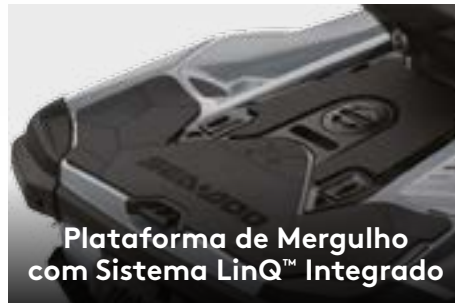
Plataforma de Mergulho com Sistema LinQ™ Integrado

Amplio compartimento de carga frontal, facilmente acessível a partir de uma posição sentada. 1