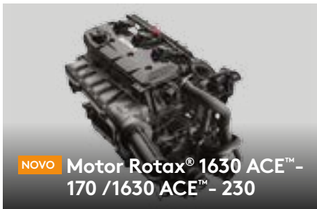
NOVO Motor Rotax® 1630 ACE™ - 170 / 1630 ACE™ - 230

O primeiro Sistema de Áudio Bluetooth ‡ instalado de fábrica, verdadeiramente à prova d'água. 2