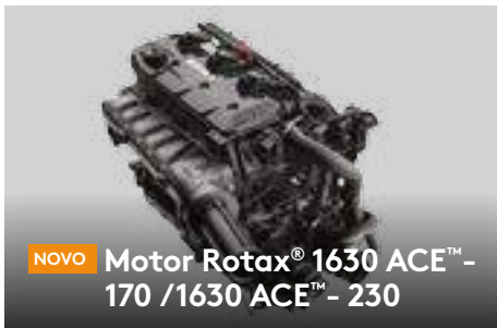
NOVO Motor Rotax® 1630 ACE™ - 170 / 1630 ACE™ - 230

O primeiro Sistema de Áudio Bluetooth ‡ instalado de fábrica, verdadeiramente à prova d'água. 2