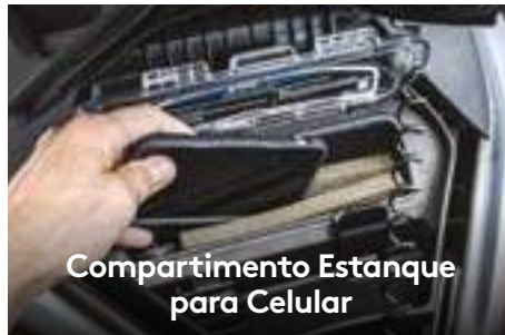
Compartmento Estanque para Celular

O motor Rotax® 1630 ACE - 230 oferece aceleração instantânea por conta de um potente supercharger, enquanto o novo Rotax® 1630 ACE™ - 170 é o mais potente motor Rotax aspirado a equipar um Sea-Doo.