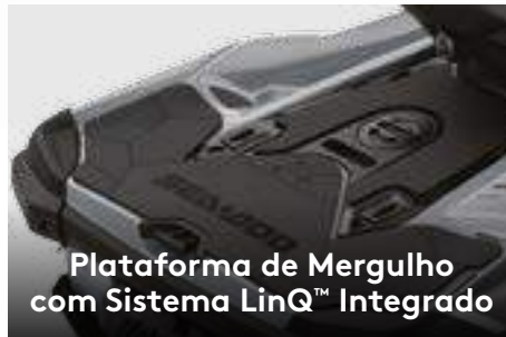
Plataforma de Mergulho com Sistema LinQ™ Integrado

Amplio compartimento de carga frontal, facilmente acessível a partir de uma posição sentada. 1