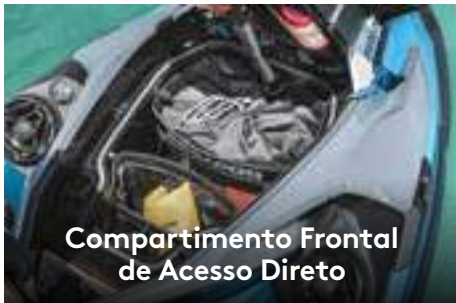
Compartmento Frontal de Acesso Direto

Amplio compartimento de carga frontal, facilmente acessível a partir de uma posição sentada. 1