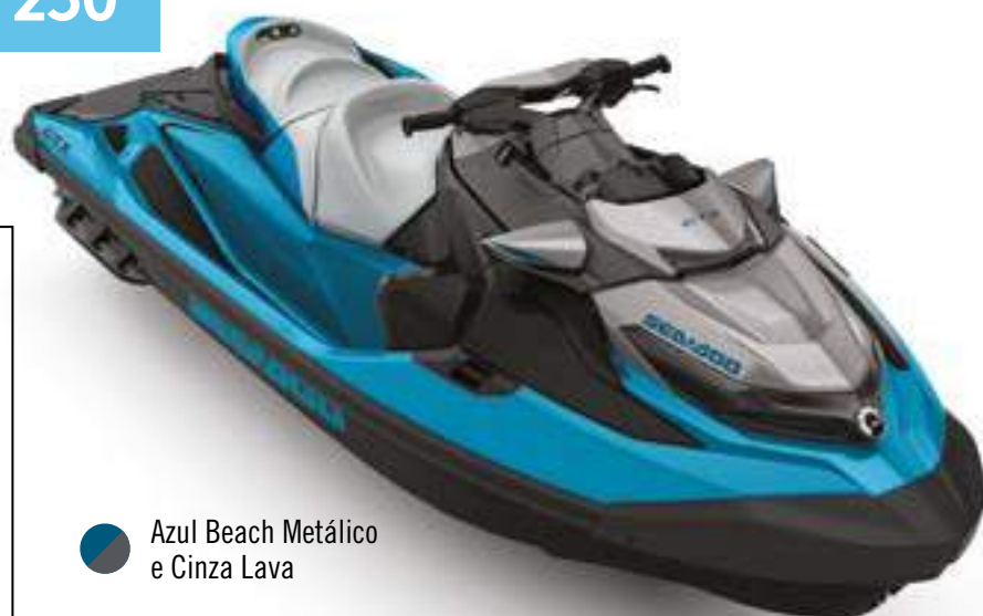
● Azul Beach Metálico e Cinza Lava